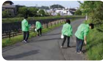
社会貢献活動「ゴミ拾い活動」